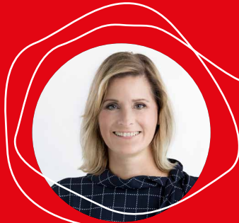
Sabrina Oswald Futura GmbH www.futura-comm.at