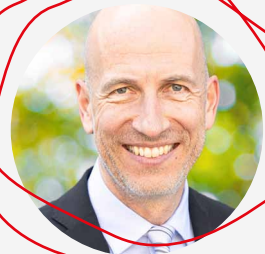
Univ.-Prof. Dr. Martin Kocher Bundesminister für Arbeit und Wirtschaft

Ich freue mich, dass wir mit unserer Kreativwirtschaftsstrategie für Österreich dazu beitragen können, Innovation und Transformation in der gesamten österreichischen Wirtschaft voranzutreiben!