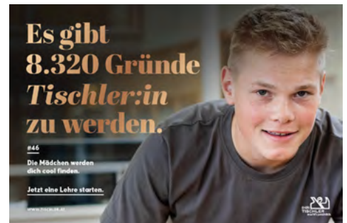
12 Sujet 1