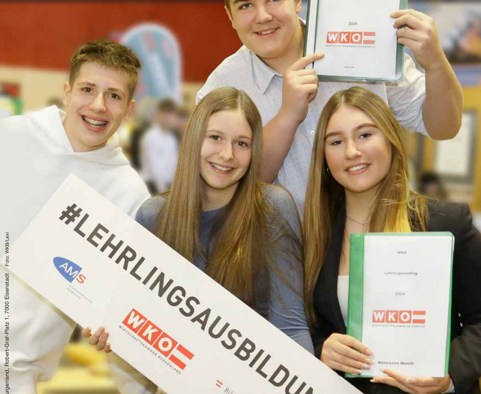
Absender: Wirtschaftskammer Burgenland, Robert-Graf-Platz 1, 7000 Eisenstadt