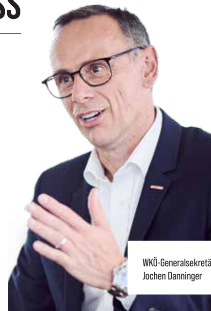
WKÖ-Generalsekretär Jochen Danninger

In ganz Europa gibt es große Zurückhaltung bei der Umsetzung der Richtlinie: Nur sehr wenige EU-Länder haben bislang konkrete Entwürfe vorgelegt. Viele Staaten prüfen noch, wie sich die Vorgaben überhaupt in ihre nationalen Systeme integrieren lassen. Wichtig sei für Österreich bei