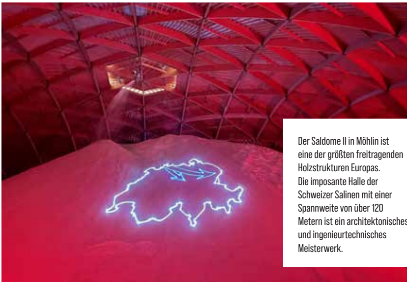
Der Saldome II in Möhlin ist eine der größten freitragenden Holzstrukturen Europas. Die imposante Halle der Schweizer Salinen mit einer Spannweite von über 120 Metern ist ein architektonisches und ingenieurtechnisches Meisterwerk.

Trotz aller technologischen Innovationen erlebt zugleich Traditionelles eine Renaissance: So wird etwa wieder verstärkt mit Lehm gebaut. Moderne Roboter verarbeiten dabei natürliche Materialien im sogenannten Impact-Printing-Verfahren. Gleichzeitig wird intensiv an CO 2 -negativen Bauweisen geforscht – also an zukunftsweisenden Gebäuden, die der Atmosphäre mehr Kohlendioxid entziehen, als bei ihrer Herstellung freigesetzt wird, und damit neue Maßstäbe für ressourcenschonendes Bauen setzen.