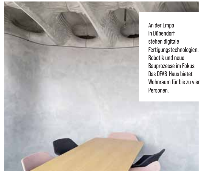
An der Empa in Dübendorf stehen digitale Fertigungstechnologien, Robotik und neue Bauprozesse im Fokus: Das DFAB-Haus bietet Wohnraum für bis zu vier Personen.