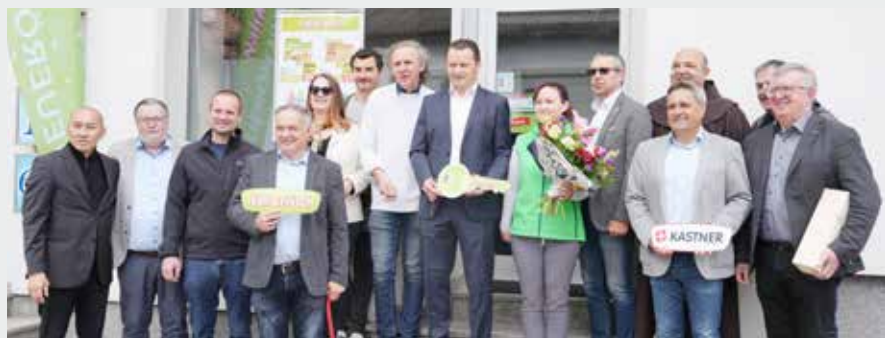
Nah & Frisch | Großwarasdorf - In der Gemeinde wurde das neue, multifunktionale Kommunikationszentrum seiner Bestimmung übergeben. Das Projekt vereint das Tagesseniorenzentrum „Centar 60+“, das vietnamesische Restaurant „House of PHO“ sowie einen Nah&Frisch-Markt. Vertreter der Wirtschaftskammer wünschten viel Erfolg.