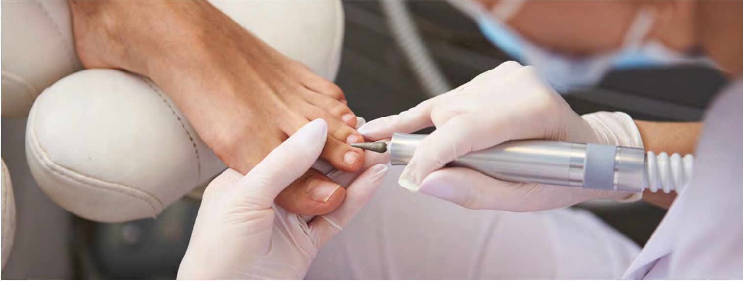
Business News | Fotos: Adobe Stock, David Schermann