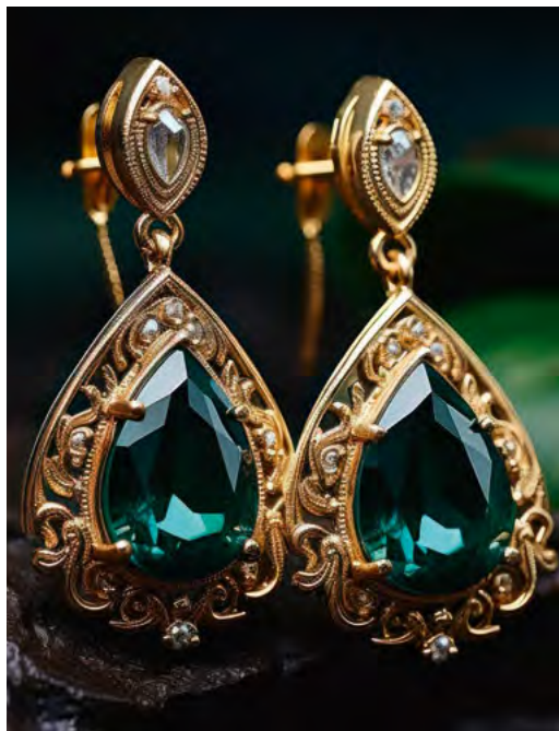
Business News

Schmuck soll nicht nur in der Schublade liegen. Er will getragen werden und soll Ihr Herz erfreuen. Das gilt vor allem für alte Edelsteine. Viel zu oft liegen sie zu Hause herum, da man mit ihnen zwar noch schöne Erinnerungen verbindet, aber das dazugehörige Schmuckstück einem nicht mehr gefällt. Hier sind die burgenländischen Kunsthandwerke der richtige Partner. Sie lieben die Herausforderung, zusammen mit Ihnen etwas Bestehendes völlig anders zu interpretieren. Dabei stehen Ihre persönlichen Wünsche im Mittelpunkt. Darauf beruhend, wird Altem, das nicht mehr