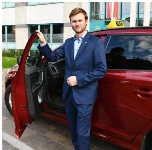
Business News