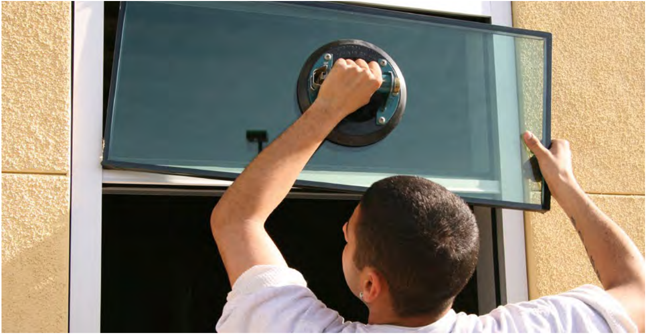
Business News

Platz für Kreativität und individuelle Wünsche. Die regionalen Fachbetriebe können somit jedes Werkstück maßgeschneidert Ihren eigenen vier Wänden anpassen.