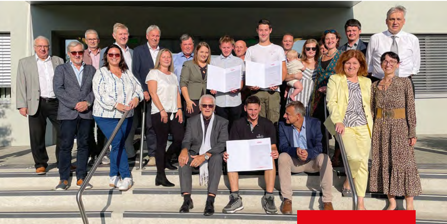
Die Sieger des Landeslehrlingswettbewerbs Bau wurden im Rahmen der Fachgruppentagung in Bad Tatzmannsdorf mit ihren Ausbildungsbetrieben und Familien geehrt.