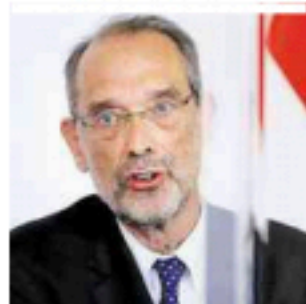
Bildungsminister Faßmann will Schulstart ohne Maskenpflicht