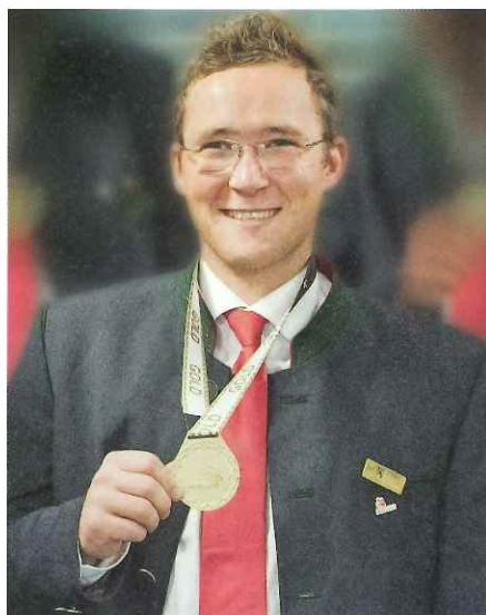
Skills Austria / WKO

Durch ausgewählte Platzierungen zwischen 5 und 8 Uhr sowie zwischen 17 und 22 Uhr werden mit rund 100 Schaltungen rund 1,3 Millionen Jugendliche im Alter von 13 bis 19 Jahren und ca. 7,4 Millionen Erwachsene zwischen 30 und 50 Jahren erreicht. Dies entspricht 60 Prozent der Zielgruppe, die sich sowohl aus Schülern und Jugendlichen sowie Eltern von Schülern zusammensetzt. Ziel der BauDeineZukunft-Kampagne ist es, Jugendliche dazu zu bewegen, die Baulehre als Ausbildungsweg zu wählen.