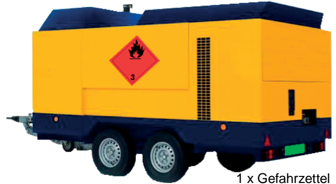
1 x Gefahrzettel 10 x 10 cm

Fassungsraum über 450 Liter - maximal 1.500 Liter