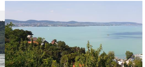
Panorama von Tihany