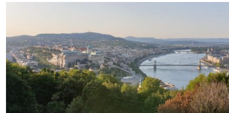
Panorama vom Gellertberg

Bitte die Badesachen schon in der Früh in den Bus mitnehmen!