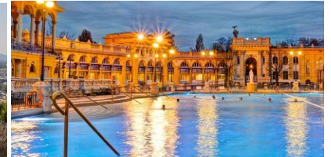
Széchenyi Thermalbad am Abend