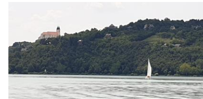
Balaton mit Tihanyer Abtei

8:30-18:00 Uhr Heute unternehmen wir einen Ganztagesausflug zum Balaton/Plattensee mit Besuch von Balatonfüred und Tihany; Mittagessen mit Weinverkostung unterwegs. Anschließend freie Abendgestaltung (Budapester Nachtleben)