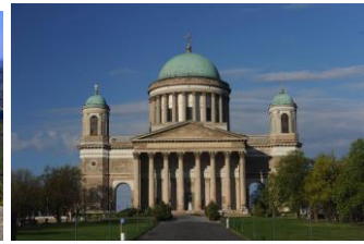
Basilika von Esztergom