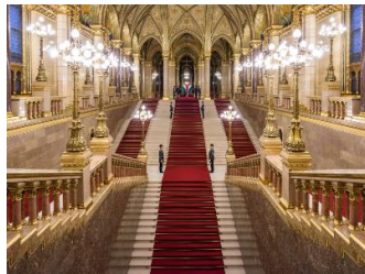
das Parlament von innen

ca.8:30 Uhr Busabfahrt vom Hotel 9:00/10.00 -11.00 Uhr ( genaue Zeit wird noch bekanntgegeben ) Wir besichtigen entweder das Parlament oder das Opernhaus, jeweils mit einer Führung (Bitte gebt am Anmeldeformular bekannt, an welcher Besichtigung Ihr teilnehmen wollt! Die Mehrheit entscheidet!) Danach Bustransfer zum Keleti-Bahnhof und Rückreise mit dem Railjet 64 (ab 11.40 Uhr) Richtung Wien.