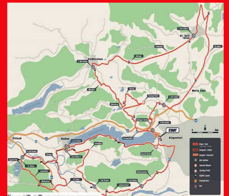
Die neue 180 Kilometer Radstrecke