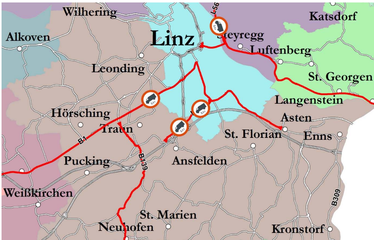
Grafik: Land OÖ, DORIS Systemgruppe

Für den Durchzugsverkehr mit LKW über 3,5 t höchstzulässigem Gesamtgewicht gibt es auf vielen möglichen Ausweichrouten Fahrverbote (Fahrverbot für Lastkraftfahrzeuge auf bestimmten Straßenstrecken im Bundesland Oberösterreich LGBL. Nr. 37/2004 idgF - siehe rot gekennzeichnete Strecken in der folgenden Grafik).