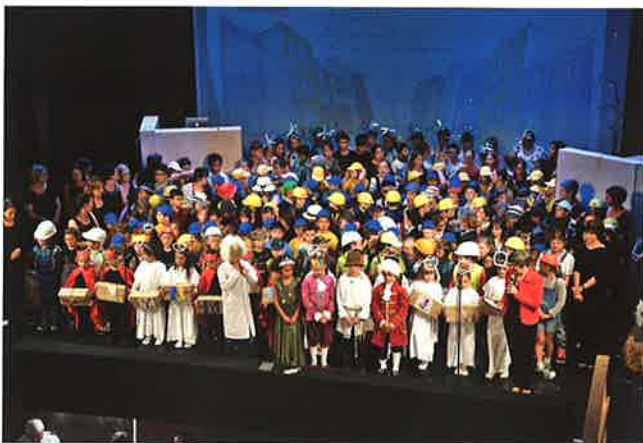
Nach der erfolgreichen Premiere waren die umfangreichen Vorbereitungen und die anstrengende Probenarbeit schnell vergessen.

Das Video von der Premiere, die Musik-CD und ein reich bebildertes Begleitbuch dienen als Vorlage für jene Schulen, welche dieses Stück ebenfalls aufführen möchten. Es ist als Hörspiel für Volksschulen und Blasmusikkapellen konzipiert.