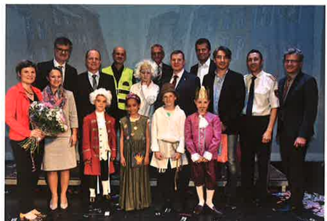
Große Freude bei allen über die gelungene Premiere.