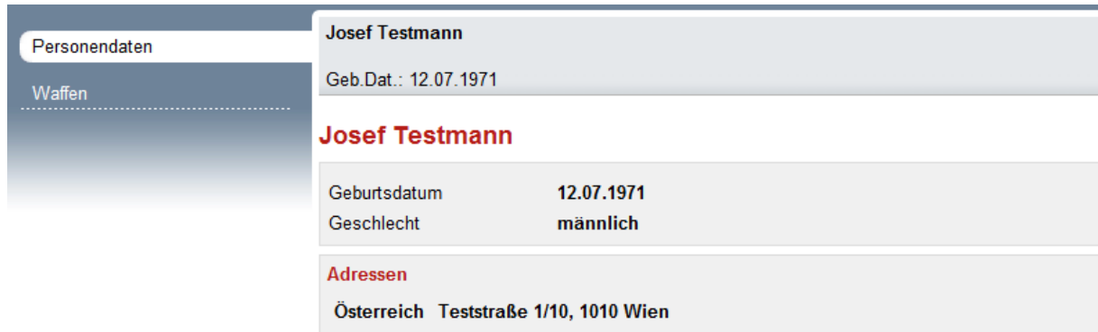
Abbildung 1 - Personendaten inkl. Adressen

Nach erfolgreichem Login in ZWR wird nachfolgende Seite angezeigt: