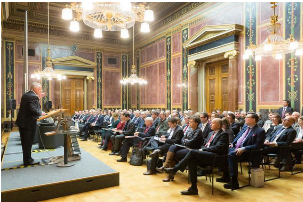
Plenum der Enquete im Abgeordnetenzimmer

Bereits im Vorfeld der Veranstaltung waren Vertreter aller Parteien zu einem Zukunftsgespräch über notwendige Entwicklungsschritte für das Pensionssystem geladen. Ergebnisse dieses Gesprächs flossen in die Enquete ein. Zu dieser hatten der Fachverband der Pensionskassen, der Verband der Versicherungsunternehmen Österreichs, die Plattform der betrieblichen Vorsorgekassen und die Vereinigung Österreichischer Investmentgesellschaften geladen.