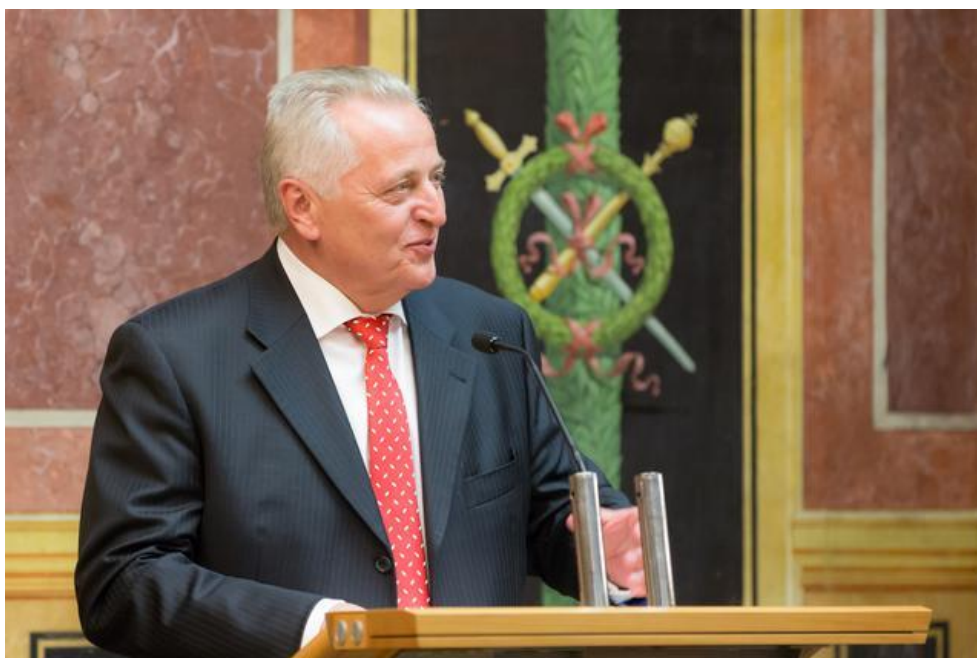
Bundesminister Rudolf Hundstorfer

Sicherung des Pensionssystems. „Abseits von zurzeit medial oft dominierenden Fragen zur Entwicklung der ersten Säule - beispielsweise ‚Reicht eine Anhebung des faktischen Pensionsantrittsalters?‘ ging es bei unserer Enquete um weitergehende Ansätze“, so Andreas Zakostelsky, Obmann des Fachverbandes der Pensionskassen. „Im Mittelpunkt stand eine substantielle Ergänzung der staatlichen Pension. Die 2. und 3. Säule sehen sich klar als solche Ergänzung, keinesfalls als Konkurrenz oder gar Ersatz des staatlichen Systems.“