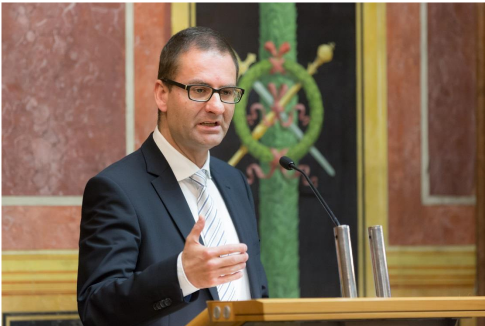
Martin Kaiser

weniger an staatlicher Pension beziehen werden können. Auch bei der Enquete wurde aufgezeigt: Der Beitrag der 2. und 3. Säulen des Pensionssystems kann das verfügbare Pensionseinkommen deutlich und nachhaltig steigern. Die durchschnittliche ASVG-Pension in Österreich beträgt aktuell 1.062,66 Euro brutto pro Monat (Quelle: PVA, 12/2014). Die Pensionskassen haben 2014 (als Beispiel) für einen Anbieter der 2. Säule eine durchschnittliche Pensionskassenpension von 491 Euro pro Monat ausbezahlt.