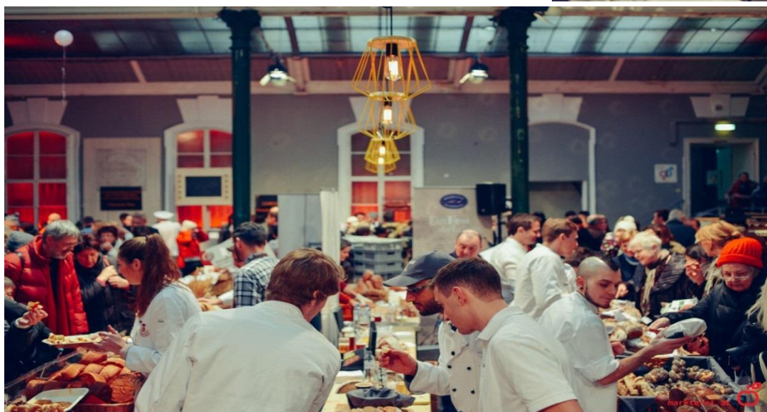
Marktereie Markthalle Alte Post

Wir informieren Sie, sobald uns weitere aktuelle Informationen und Pressestimmen vorliegen.