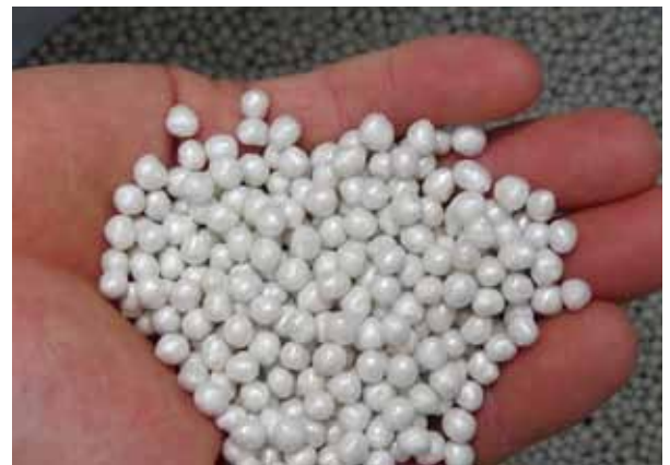
Extrudiertes Granulat

In Österreich liegt der jährliche Bedarf an gebundenen Dämmschüttungen bei ca. 650.000m 3 pro Jahr (das entspricht ca. 13.000t EPS-Abfall). Für die Verarbeitung am Bau sind zudem durchschnittlich 75 Liter Wasser pro verarbeitetem Kubikmeter (m 3 ) zum Abmischen notwendig. Mit den in Österreich anfallenden EPS-Abfallmengen könnten mit diesem neuen Recyclingverfahren ca. 400.000m 3 Wär-