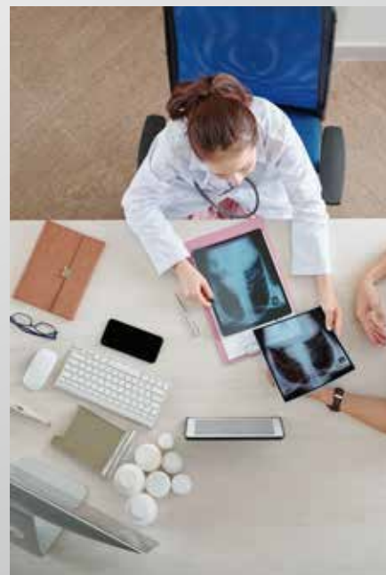
Eine private Krankenversicherung bietet viele Vorteile und zusätzliche Sicherheit im Krankheitsfall.

Alle Infos unter https://www.wko.at/branchen/sbg/information-consulting/neue-private-kranken-gruppenversicherung.html