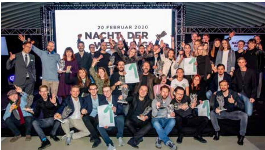
Bilder (3): wildbild

■ Alle Preisträger, Bilder und Videos unter www.salzburger-landespreis.at/events/nacht_der_werbung/