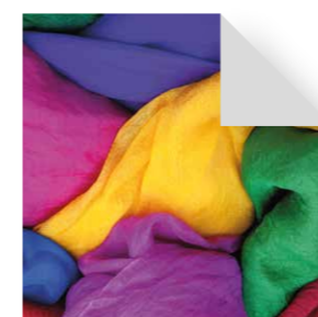
Farb- und Typberatung