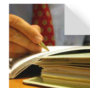
Sonstige persönliche Dienstleistungsunternehmen