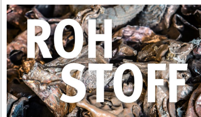
Rohstoffmagazin - die neuen Goldgräber