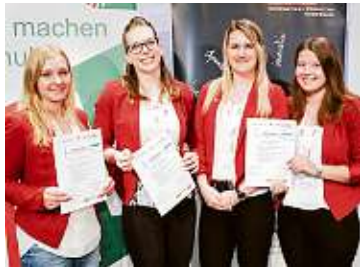
Sie besuchten die Buchhandlung Plautz in Gleisdorf

„Die Schülerinnen und Schüler können in einer Kleingruppe zwei sogenannte ‚My Compa-