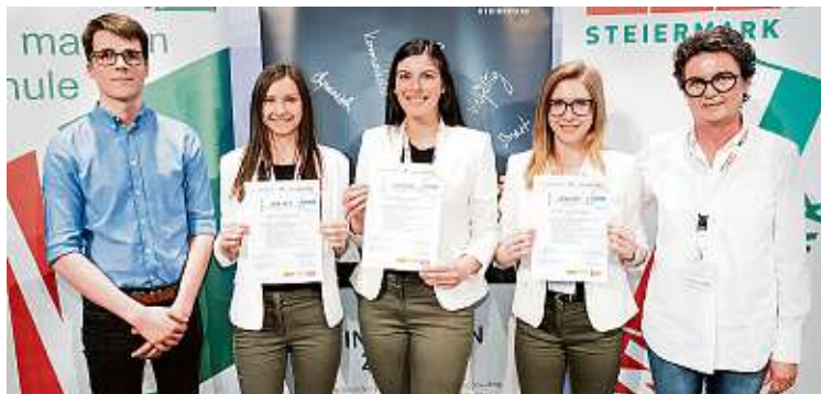
Sie schnupperten bei Müllex in St. Margarethen an der Raab

„HAK Forward“ in Graz. Außerdem entstanden dadurch 60 Diplomarbeiten. Auch zwei Gruppen der HAK Weiz erhielten diesmal Einblicke in den betrieblichen Arbeitsalltag: Sie besuchten einerseits die Buchhandlung Plautz in Gleisdorf und andererseits Müllex in St. Margarethen an der Raab.