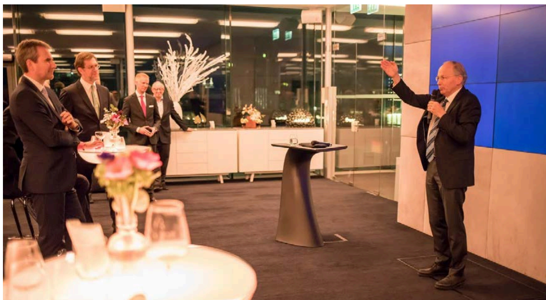
Finanzminister Löger und Abg.z.NR Univ.-Prof. Dr. Taschner

Univ.-Prof. Rudolf Taschner wies in seinem humorvollen Vortrag darauf hin, dass die Digitalisierung künftig auch die Arbeitswelt grundlegend verändern wird. Er rief eine "neue Gründerzeit" aus, in der auch der Begriff "Pension" eine Umdeutung erfahren werde, da neue Technologien ein befriedigendes (Weiter-)Arbeiten auch im Pensionsalter ermöglichen werden.