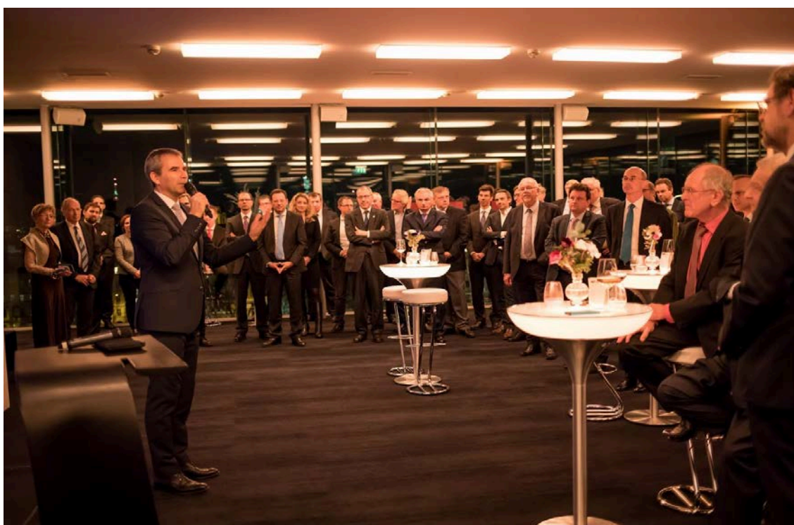
Finanzminister Löger hielt die Keynote

Der traditionelle Neujahrsempfang des Fachverbandes der Pensionskassen ist mittlerweile ein Fixpunkt für die führenden Vertreter der Branche und der Finanzwelt.