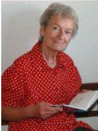
Lilo Galley Innsbruck, T