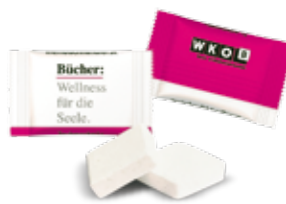
Lesezeichen, Plakate und Traubenzucker sollen die Leser an den Buchhandel Österreichs binden.