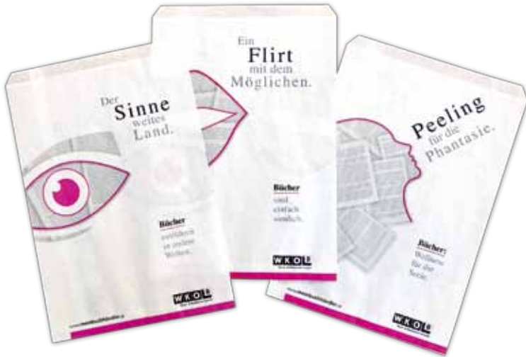
Falttaschen sind eines der Werbemittel für alle Buchhandlungen quer durch Österreich.