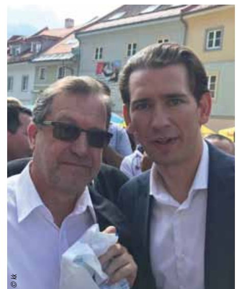
Sebastian Kurz sicherte Friedrich Hinterschweiger seine Unterstützung für Österreichs Buchbranche zu.

Im Gespräch ging es vor allem um die Digitalisierung der Schulmedien, die seit Jahren von Österreichs Bildungsverlagen vorangetrieben werden.