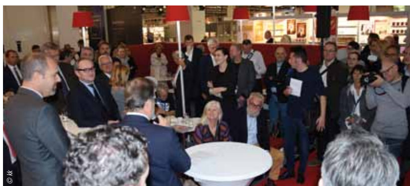
Blick ins Auditorium bei der Eröffnung des Österreich-Standes