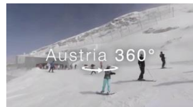
Zell am See Skifahren am Kitzsteinhorn