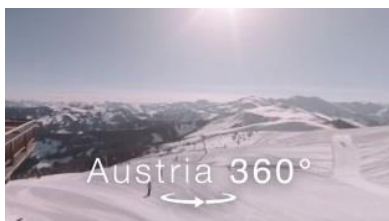
Skijuwel Alpbachtal Panoramatour durch die Schneelandschaft