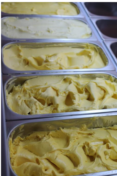
Der Star des Tages