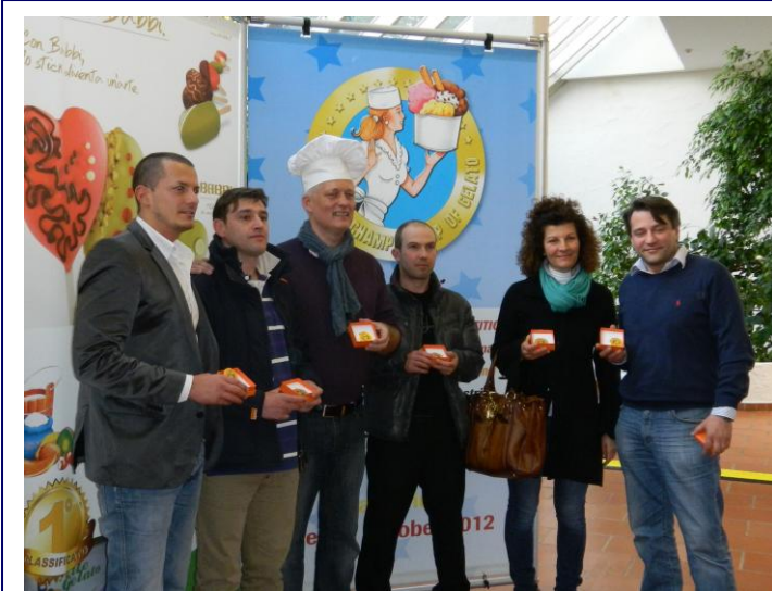
Die 6 Finalisten