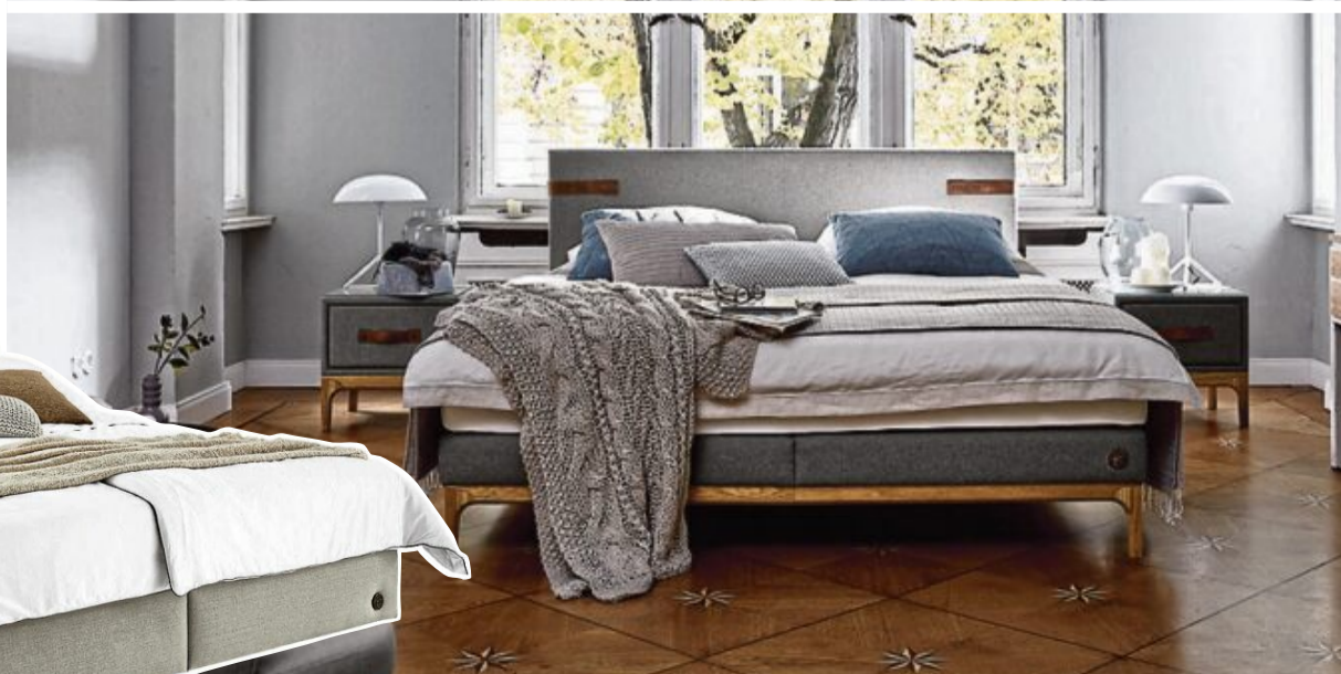
Links Boxspringbett „Linz“, rechts Boxspringbett „lona“ von BIRKENSTOCK

Ob großzügiges Bett oder ein verwandlungsfähiges Sofa, mit dem man leicht vom Tages- in den Nachtmodus wechseln kann – der Wiener Einrichtungshandel hat die Expertise für die bestmögliche Bettruhe. In diesem Sinn: Schlafen Sie gut!