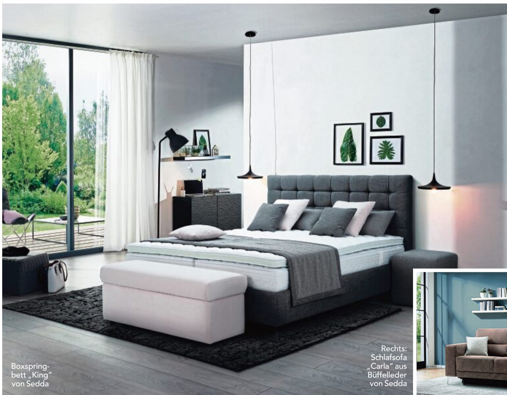
Boxspringbett „King“ von Sedda

Wiener Einrichtungshandel. Garant für hochwertige Betten und Schlafsofas, somit für gesunden Schlaf und Lebensqualität