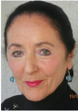
Hanna Lux Graz, Stmk