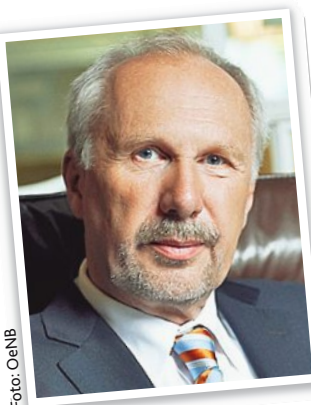
Prof. Dr. E. Nowotny, OeNB-Gouverneur a. D.

Finanzminister Hartwig Löger im April über seine Vorgänger.