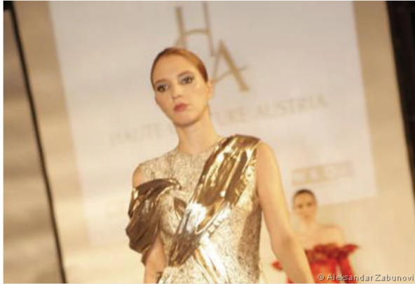
Die besten und kreativsten Entwürfe Österreichs wurden ausgezeichnet

Gestern wurden die Haute Couture Austria Awards in Wien verliehen. Highlights waren die ausgefallenen Kreationen von Nachwuchskünstlern.