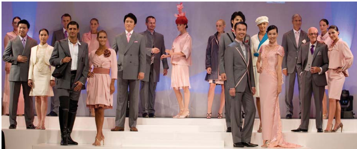
Vergleichsmodelle der teilgenommenen Länder