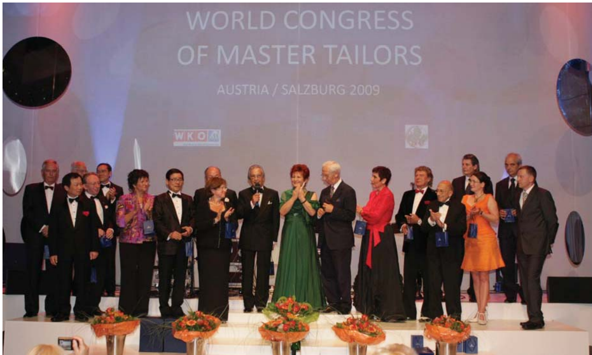
Präsidenten der Teilnehmerländer