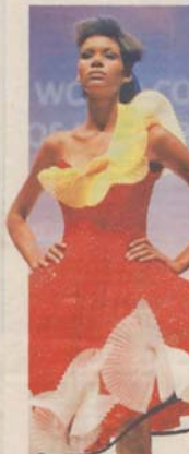
Kreative Mode auf den Salzburger Laufsteg.