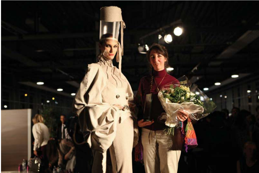
Die Sieger des Haute Couture Austria Awards 2009