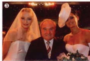
4 LET THE SHOW BEGIN - MODELS IN MEISTERSTÜCKEN DER HAUTE COUTURE