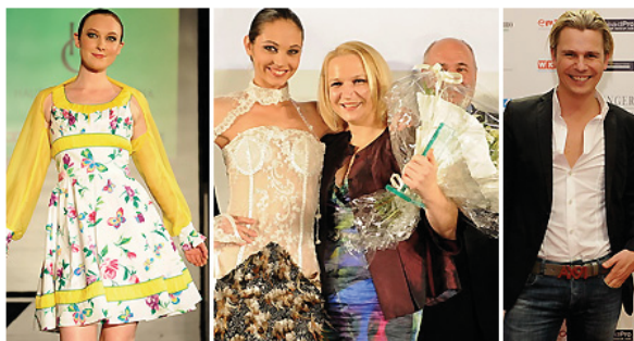
Der Abend gehörte der Mode

Online gestellt: 02.12.2009 08:07 Uhr Aktualisiert: 03.12.2009 09:30 Uhr