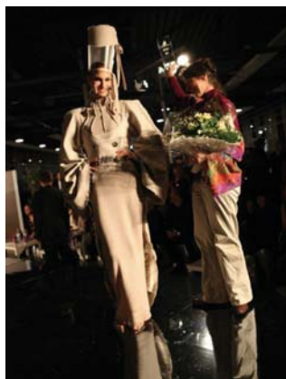
Gewinner des HCA 2009

Wir wünschen allen Teilnehmern viel Erfolg beim Haute Couture Austria Award 2010!