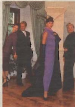
Bei der Mode-Gala der MaßkleidermacherInnen werden elegante Modelle präsentiert.