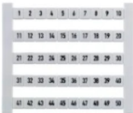
Abbildung 1: Klemmenbeschriftung

Das Werkzeug muss zum Aufbau eines Schaltschranks geeignet sein. Darüber hinaus Werkzeug nach eigenem Ermessen.