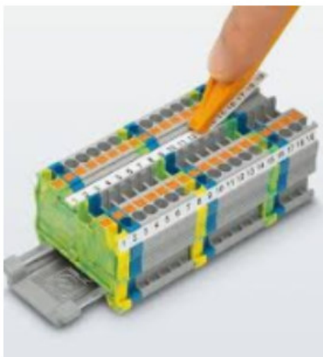
Abbildung 2: Klemmenbeschriftung