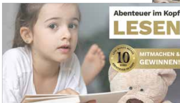
Plakat & Header Website