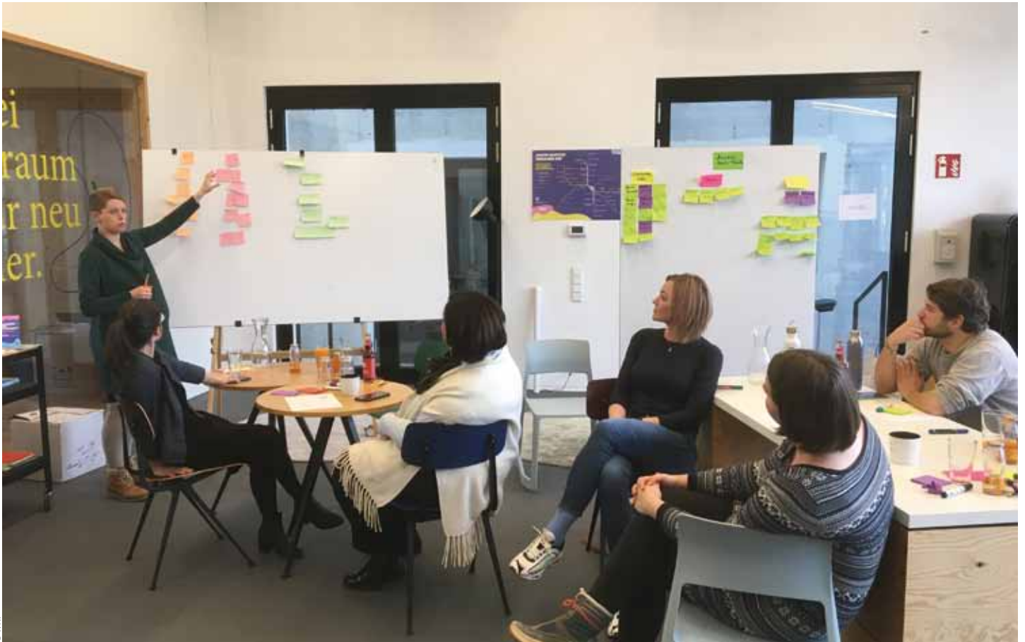
Die Teilnehmenden erarbeiteten in Kleingruppen verschiedenste innovative Lösungsansätze, die die Branche zukunftsfit machen.