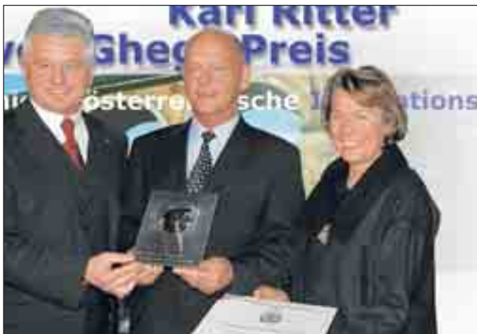
Sieger NÖ Innovationspreis 2006, Lisec GmbH

Die Wirtschaftskammer NÖ & die Wirtschaftsförderung des Landes NÖ kooperieren seit vielen Jahren, um die Innovationsförderung konkret zu verbessern und ein neues Klima für Innovation in Niederösterreich zu schaffen. In den letzten Jahren wurden wieder bahnbrechende Erfindungen & kreative Ideen mit großem Potenzial von niederösterreichischen Unternehmen gemacht. Begeistern doch SIE heuer die Öffentlichkeit von Ihrer Produkt-, Verfahrens- oder Dienstleistungsinnovation. Vor allem jene der Sparten Gewerbe und Industrie haben die Möglichkeit sich einer namhaften, unabhängigen Fachjury aus der Wirtschafts- und Forschungswelt zu stellen.