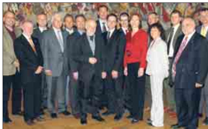
Prominente Vertreter aus Wirtschaft und Politik beim CCC in Perchtoldsdorf zum Thema „Konflikte im Geschäftsleben – Kosten, Risiken, Chancen?“

Die Kosten und Risiken von Konflikten im Geschäftsleben sind immens! Wie lässt sich angesichts dieser Tatsachen erklären, dass Management und Führungskräfte der österreichischen Unternehmen immer noch weitgehend resistent sind gegenüber Präventionsberatung und Mediation?