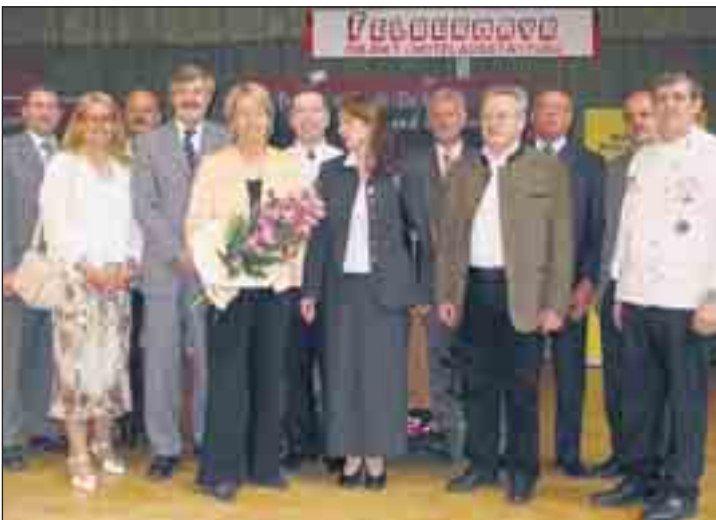
Die Festgäste bei der Eröffnung mit Landesrätin Dr. Petra Bohuslav.

April gab es ein Bürgermeisterwettkochen: Drei Bürgermeister aus der Region Bucklige Welt kochten gegen drei Bürgermeister aus dem Pittental. Täglich bestand auch die Möglichkeit im Restaurant der Nationen die Kunst der Köche bei einem Menü zu testen. Bei der Internationalen Kochkunstschau gab es auch eine Hobbyausstellung, wo Künstler aus dem Pittental und aus der Buckligen Welt ihre hervorragenden Produkte präsentierten. Im Rahmen der Kochkunstschau wurde auch die Meisterschaft im Eisschnitzen ausgetragen.