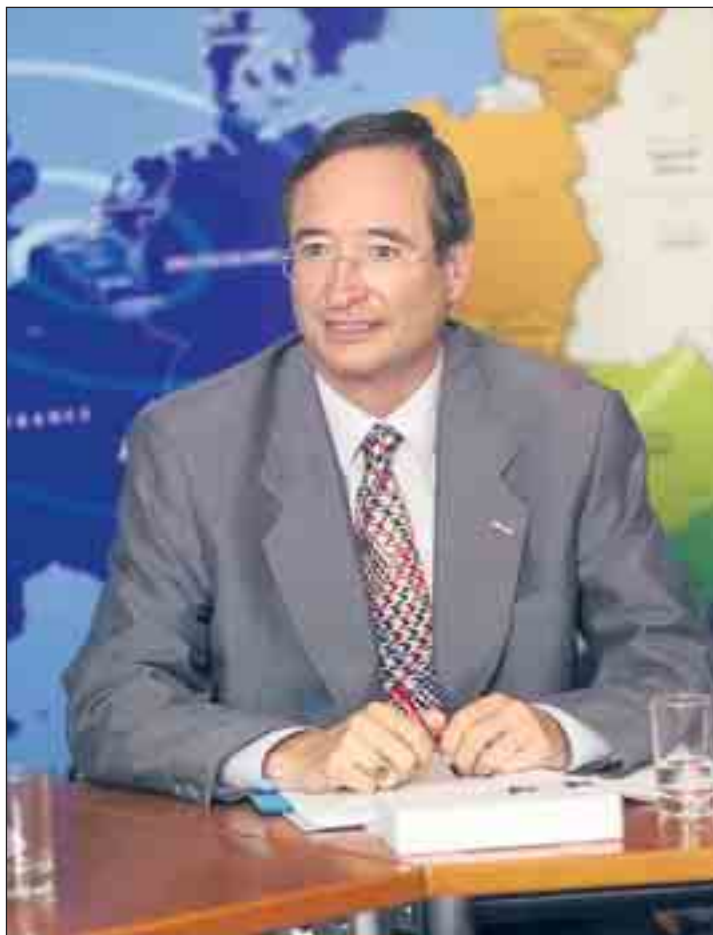
WKO-Präsident Leitl: „go international“ lautet die Devise.

Sind Sie Nicht-Exporteur? Dann überlegen Sie einmal in