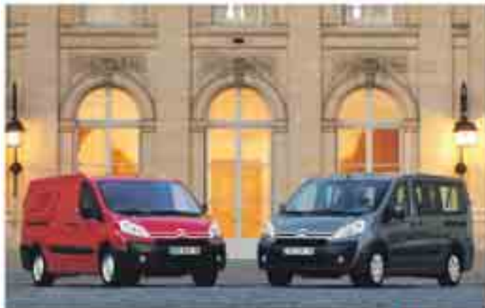
Der neue Citroën Jumpy