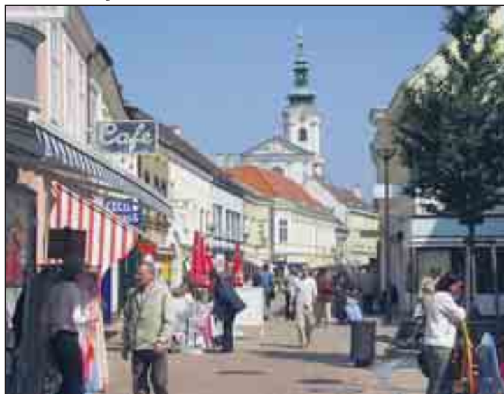
Shoppern macht Spaß – besonders in der FUZO Bruck an der Leitha.

Der Abendeinkauf vieler Unternehmer der Brucker Innenstadt war wieder ein voller Erfolg. Die Besucher und Kunden hatten Gelegenheit, am Freitag bis 21 Uhr und am Samstag bis 17 Uhr ein passendes Geschenk für den Muttertag zu finden. Mit tollen Angeboten und vielen Aktionen (meist) ab 17 Uhr erfreuten die Unternehmer die Kunden. Beim Kulinarikpavillon der Brucker Werbegemeinschaft wurde man am Freitag von 17 bis 21 Uhr mit italienischen Schmankerln, Prosecco