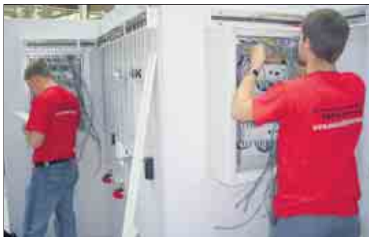
Lehrlinge bei der Lösung ihrer Aufgabenstellung.