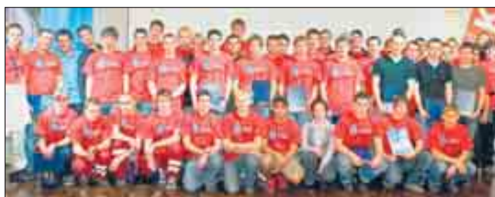
Die erfolgreichen Gewinner beim „Tag des High-Tec Lehrlings“.

Am 27. April fand zum ersten Mal der „Tag des High-Tec Lehrlings“ – vormals „Tag des Metalllehrlings“ – im WIFI St. Pölten statt. Den zahlreich erschienenen Gästen bot sich ein Einblick in die interessante Ausbildung eines Metalllehrlings.