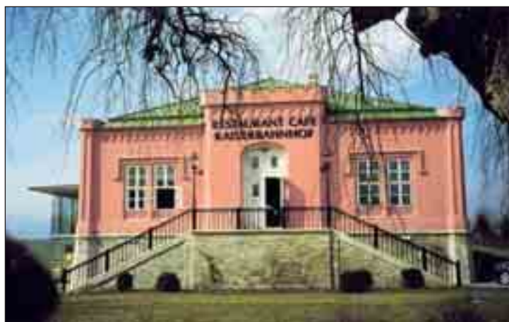
Kaiserbahnhof in Laxenburg.

1999 wurde in Niederösterreich die Initiative „Natur im Garten“ gestartet. 2008 feierte man zum wiederholten Mal ein Gartenfestival im Kamptal. Auch heuer steht wiederum die Natur im Mittelpunkt: Die Thermenregion lädt zum Thema „Rosen, Wasser und Lebensfreude“. Peter Soukup hat sich in den Gärten umgesehen.