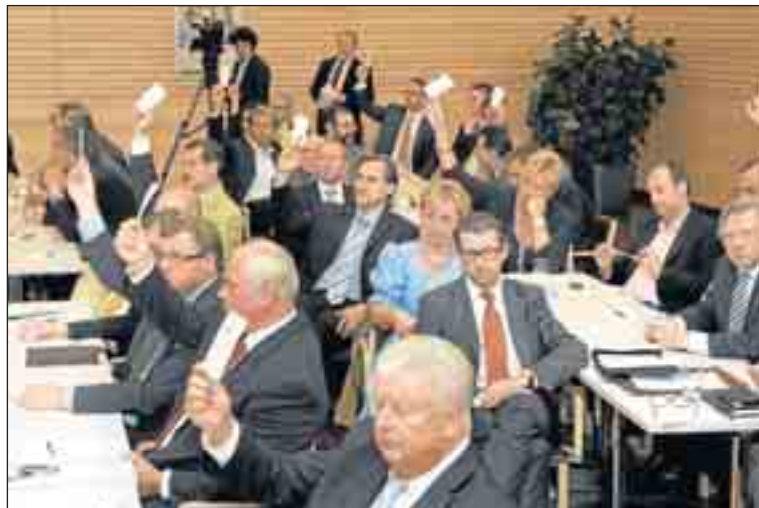
Abstimmung: Der Leitantrag des NÖ Wirtschaftsparlaments gibt die große Linie für die Kammerarbeit bis 2015 vor. Einstimmig angenommen.

Porträts der Vizepräsidenten auf Seiten 6 und 7.