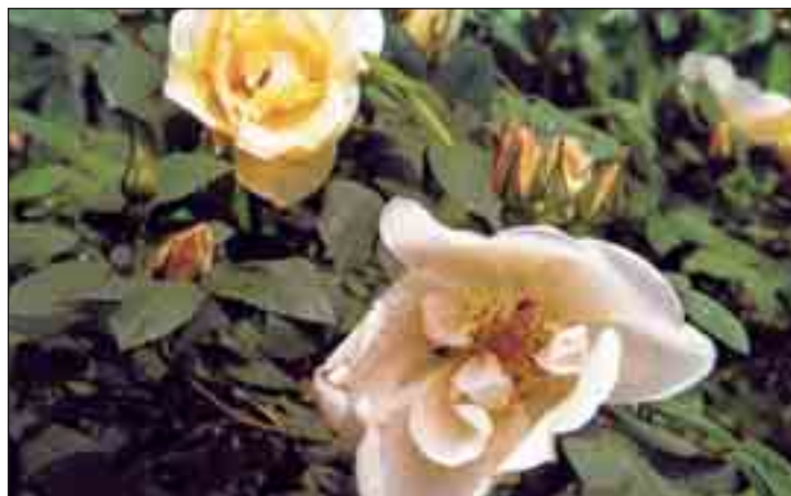
Rosen im Rosarium in Baden.

In den vier Wochen vom 22. Mai bis 20. Juni 2010 werden die drei Standorte ein auf ihre Historie und geographische Lage abgestimmtes Programm bieten.