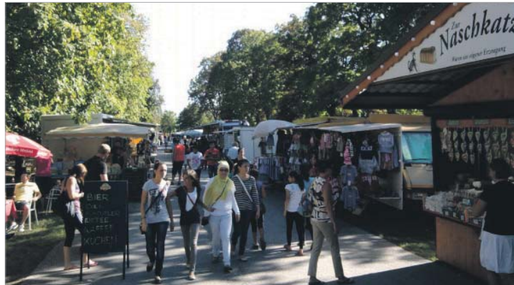
Entspanntes Markttreiben am Badener Trabrennplatz

Gemeinsam mit dem Badener Trabrennverein organisierte das Landesgremium der Marktfahrer unter Obmann Gerhard Lackstätter den 1. Badener Großkirtag: