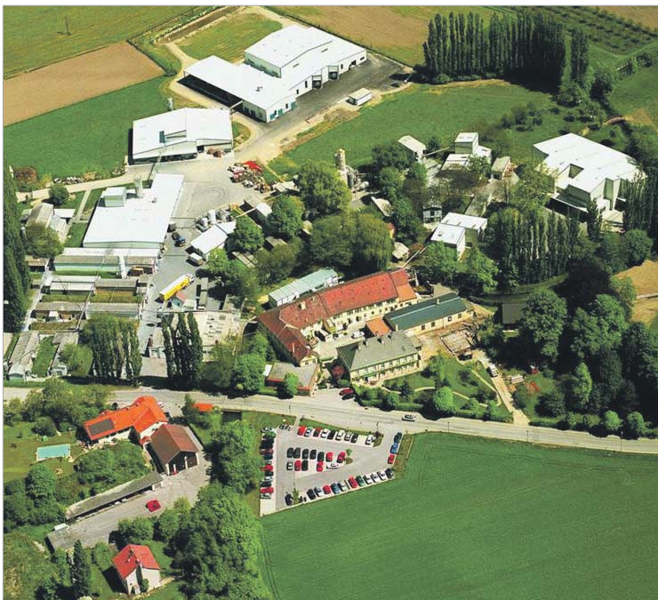
Am Bild: die Benda-Lutz Werke in Traismauer aus der Vogelperspektive

Das Unternehmen ist mehr als 50 mal rund um den Globus vertreten. Die Produkte von Benda-Lutz-Produkte werden im Stammhaus in Traismauer und in Polen, den USA und in Taiwan hergestellt.