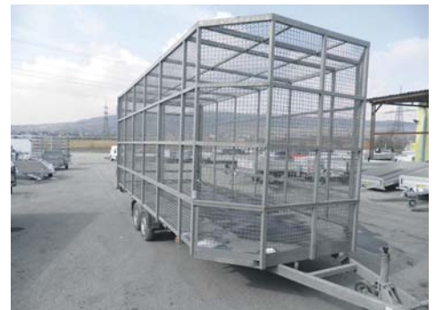
Gitter Anhänger Spezialanfertigung