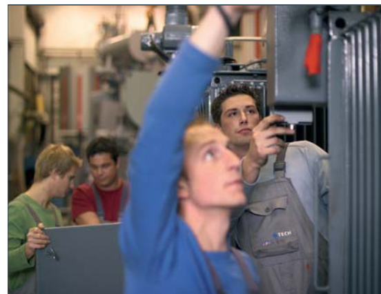
Vor allem für Junge müssen Jobs geschaffen werden.

Die EU-Kommission müsse zudem „eine kundenfreundlichere Rolle“ übernehmen, so Spindelegger. „Ich möchte, dass die Kommission auch zum Dienstleister wird für kleinere und mittlere Unternehmen.“