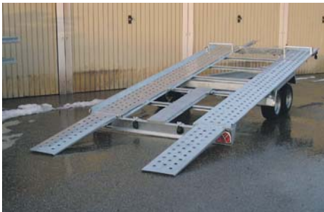
Pongratz L-AT 400