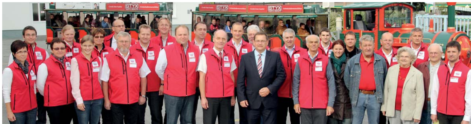
Die Agrana-Mitarbeiter ermöglichten den Besuchern ein abwechslungsreiches und interessantes Programm.