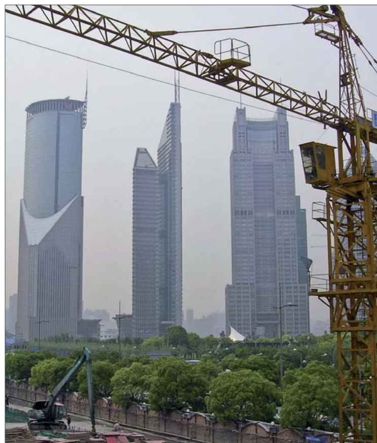
China ist nur ein Beispiel für aufstrebende Märkte.

Koren: „An diesen Staaten führt kein Weg vorbei. Das was ihnen aber noch fehlt, ist ein Modernisierungsschub durch innovative Ideen und Produkte.“ Auf dem Weg dorthin werden österreichi-