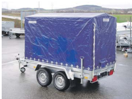
Humbaur Hochplane 2026

Viele Anhänger lagernd und somit sofort Verfügbar. Alle weiteren gegen Bestellung!