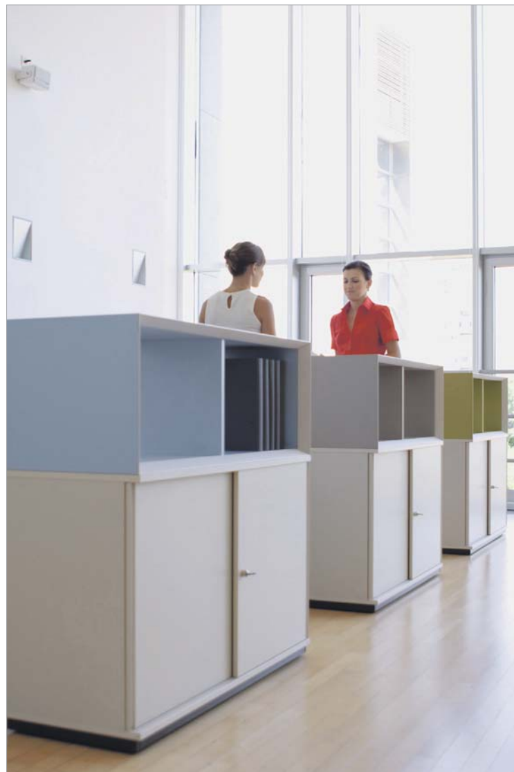
Eines der Beispiele aus dem Angebot des Mass-Customization-Spezialisten Bene aus Niederösterreich: Die Modulbox zur Gliederung offener Arbeitslandschaften.

Hier gibt es sicher noch viel Wachstumspotenzial und es ent-