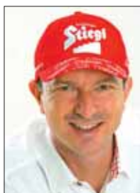
Alexander Pointner, ehemaliger ÖSV-Cheftrainer der spricht zum Thema „Change“.