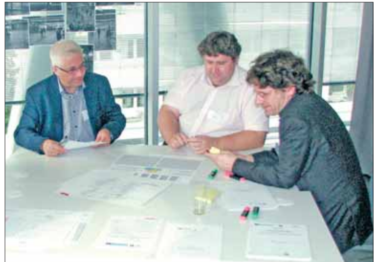
In intensiven Gruppenarbeiten wurden Ansätze für Projekte entwickelt, die nun in individuellen Beratungen konkretisiert werden.