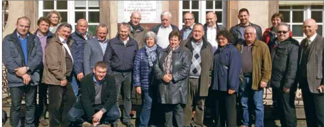
Die Teilnehmer-Gruppe der Weinreise vor dem Hospice Strasbourg.