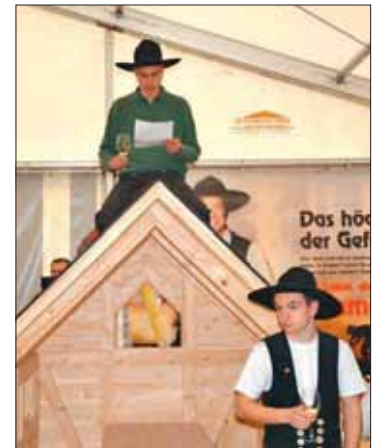
Höhepunkt: Verlesung des Gleichenspruchs nach Fertigstellung.