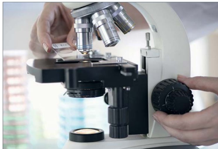
Forschungsförderung ist ein wichtiger Wachstumsimpuls.

Fakt sei, dass die gemeinsamen Investitionen der Wirtschaft, des