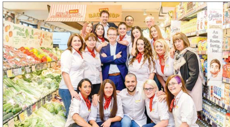
Das Team der neuen BILLA Filiale Wiener Neustadt.

Mit einem neuen Konzept setzt BILLA einen der größten Konsumentenwünsche um. Ein zentraler Aspekt ist die Kommunikation durch Bilder, Produktinformationen sowie die Art der Warenpräsentation, die den überwiegenden saisonalen und regionalen Anteil des BILLA-Sortiments hervorhebt. So vermitteln die Küchenfronten im Frischebereich, die angelegten Küchenutensilien sowie Markisen über Frische-, Back- und Feinkostbereich charmante Küchenatmosphäre im Landhausstil. Klassische Haushaltselemente im Getränke-Bereich, die an die häusliche Vorratskammer erinnern, sowie die Fenster-Optik im