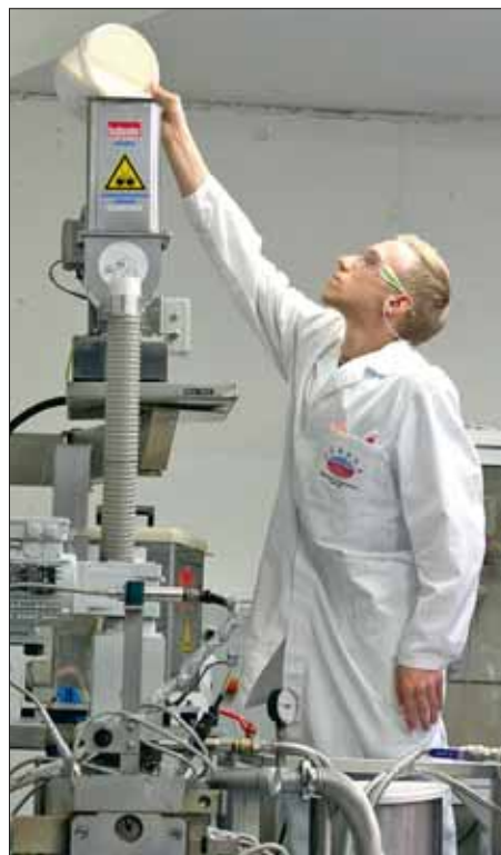
AGRANA aus Tulln stellt aus Maisstärke Bio-Kunststoff her.