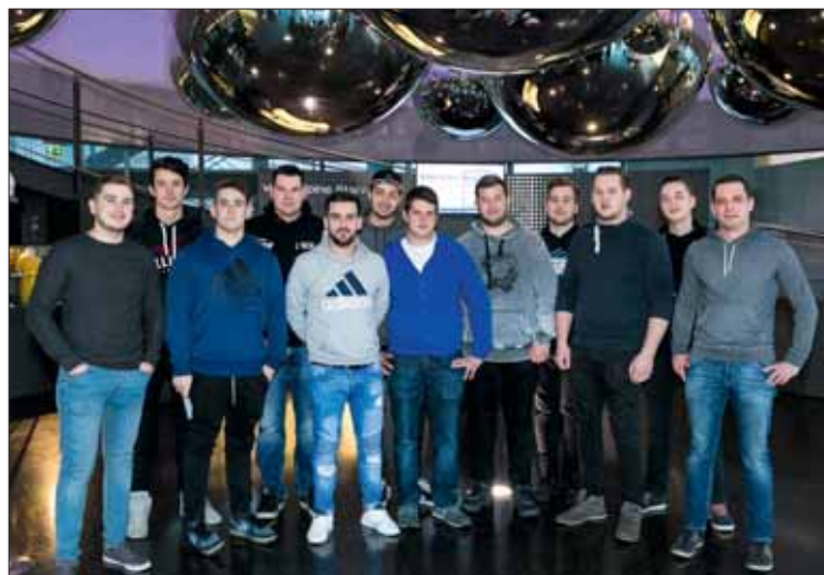
Die Kremser voestalpine-Lehrlinge in Linz.

Mit insgesamt rund 800 Jugendlichen, die sich aktuell in Österreich in 30 Berufen in Ausbildung befinden, ist die voe-