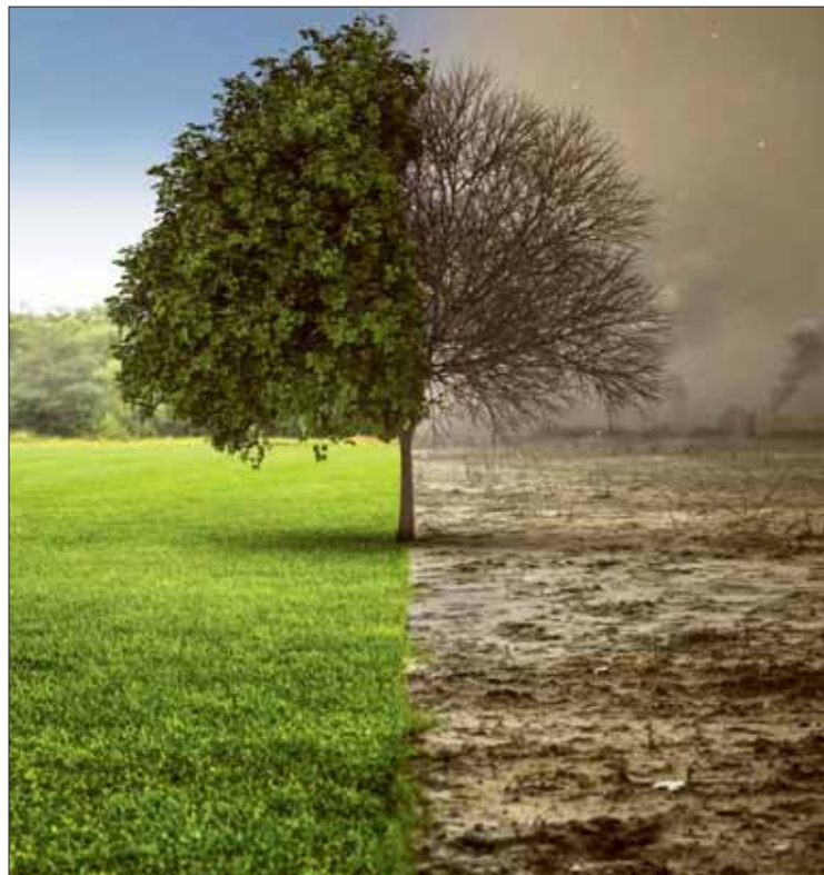
Auf Niederösterreich entfallen mit Abstand die meisten UVP-Verfahren.

Die Wirtschaftskammer NÖ-Präsidentin weist auch darauf hin, dass dies gerade für eine positive Weiterentwicklung des Wirtschaftsstandortes Niederösterreich von ganz besonderer Bedeutung sei: „Mit einem Anteil von 40 Prozent im Zeitraum von 2000 bis Ende Februar 2018 entfallen mit Abstand die meisten UVP-Verfahren in Österreich auf unser Bundesland.“