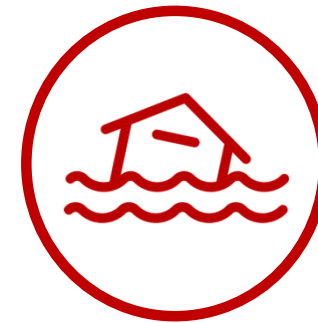
Physisches Risiko 2

= im Zusammenhang mit der Umstellung auf eine kohlenstoffarme Wirtschaft, z.B. politische und regulatorische Änderungen, disruptive Technologien oder Geschäftsmodelle sowie eine Veränderung des Marktverhaltens