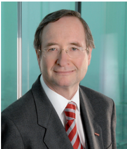
Dr. Christoph Leitl Präsident der Wirtschaftskammer Österreich Schirmherr der Charta der Vielfalt

Der volle Wortlaut auf www.charta-der-vielfalt.at .