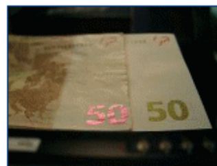
Nachahmung des Farbwechsels (OVI – Optical Variable Ink) – Euro 50 (Banknotenrückseite)