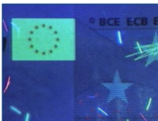
UV-Ansicht der echten Banknote