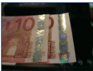
Foliennachahmung – Euro 10 (Banknotenvorderseite)

In den folgenden drei Videoclips finden Sie im direkten Vergleich jeweils rechts die echte Banknote mit Sicherheitsmerkmal und links ein Beispiel für eine Fälschung .