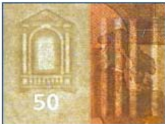
Die Wasserzeichen der echten Banknote