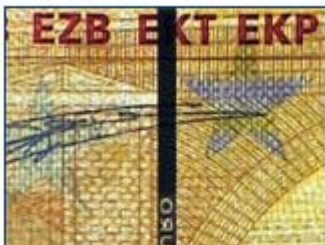
Der Sicherheitsfaden der echten Banknote