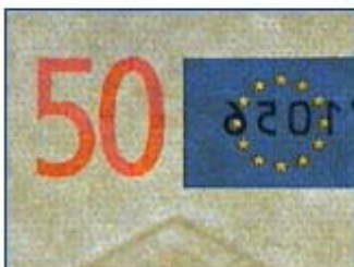
Das Durchsichtregister der echten Banknote