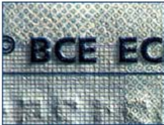
Der Stichtiefdruck der echten Banknote