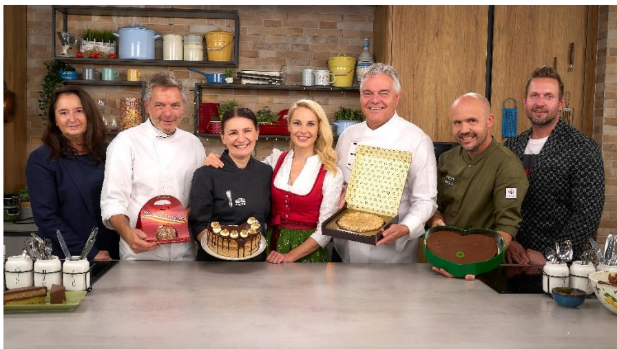
„Silvia kocht“ / MO - FR / 14:00 / ORF2

„Silvia kocht“ ist eine erfolgreiche Kochsendung auf ORF 2, moderiert von Silvia Schneider, die regelmäßig Spitzenköche - und nun auch Konditor:innen - zu Gast hat.