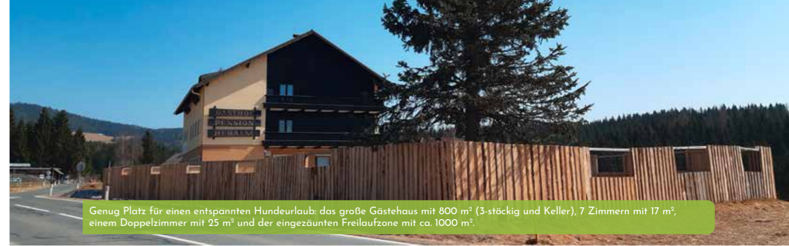
Genug Platz für einen entspannten Hundurlaub: das große Gästehaus mit 800 m 2 (3-stöckig und Keller), 7 Zimmern mit 17 m 2 , einem Doppelzimmer mit 25 m 2 und der eingezäunten Freilaufzone mit ca. 1000 m 2 .

Das Objekt hier war eigentlich eher Zufall. Wir hatten die Vorstellung von einem größeren Haus mit vielen Räumen, und unser Immobilienmakler kam dann mit der Idee von der alten Pension. Perfekt und ausschlaggebender Punkt war für uns auch, dass wir hier alles in einem haben: das große Gebäude mit den vielen Zimmern und zusätzlich noch privaten Wohnraum für uns. Wir sind hier hereingekommen und haben gewusst: DAS ist es!