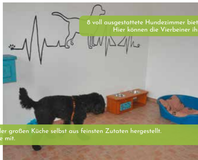
8 voll ausgestattete Hundezimmer bieten Platz für bis zu 9 Hunde gleichzeitig. Hier können die Vierbeiner ihre Ruhephasen verbringen und schlafen.