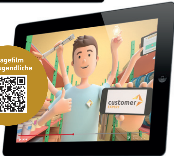
Imagefilm für Jugendliche