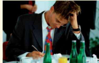
In 5 Stufen zum Ein-Personen-Unternehmer.

Die fünf Seminare werden monatlich, beginnend ab Jänner 2013 bis Mai, sowohl in Eisenstadt als auch in Oberwart angeboten.