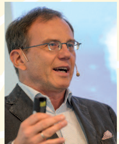
Dr. Armin Wolf begeisterte mit seinem mehr als einstündigen Referat die OÖ-Direktberater.

Diese Fragen beantwortete Dr. Wolf, der für seine Aktivitäten zum Onliner des Jahres 2012 gewählt wurde, mit einer Reihe von höchst eindrucksvollen Beispielen.