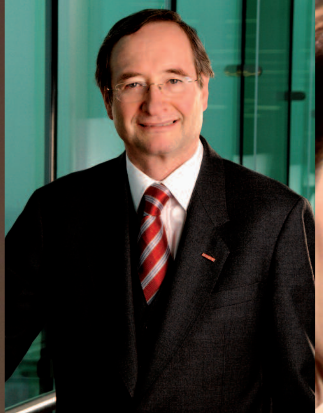
WKÖ-Präsident Dr. Christoph Leitl:

Videobotschaften von WKÖ-Präsident Christoph Leitl , Wirtschaftsminister Reinhold Mitterlehner sowie dem EU-Parlaments-Abgeordneten Paul Rübzig demonstrieren, dass sich der Direktvertrieb in den letzten 20 Jahren durch die basisorientierte Arbeit der Berufsvertretung zu einer anerkannten Alternative zum stationären Handel entwickelt hat. Die Anerkennung von Paul Rübzig ließ erkennen, dass der Direktvertrieb in Europa nicht nur bei den Menschen, sondern auch bei den EU-Institutionen angekommen ist.