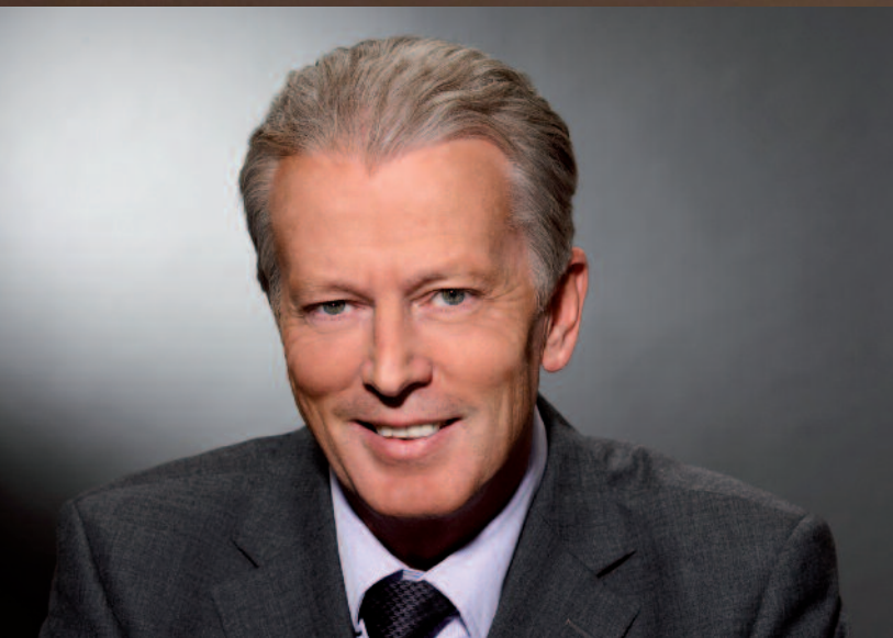
Bundesminister Dr. Reinhold Mitterlehner:

„Ihr Direktberater seid Nahversorger im Handel, Ihr seid bei den Kunden, bei den Menschen, führt persönliche Gespräche und Beratung ... daher vertrauen die Menschen den Direktberatern...“