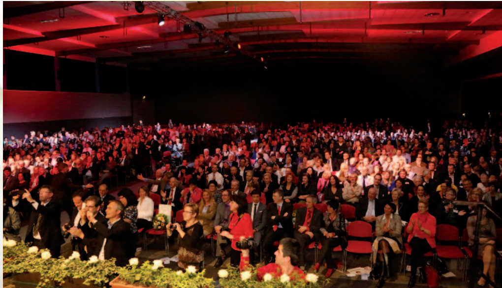
Die bis auf den letzten Platz gefüllte Halle des VAZ St. Pölten, in der rund 1.800 Gäste die spannenden, interessanten und humorvollen Vorträge verfolgten