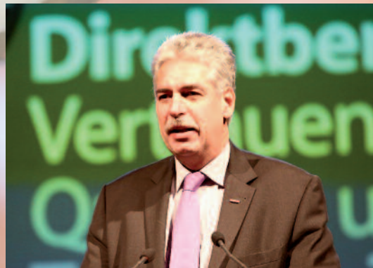
WKÖ-Vizepräsident Mag. Dr. Hans Jörg Schelling bei seiner interessanten Rede