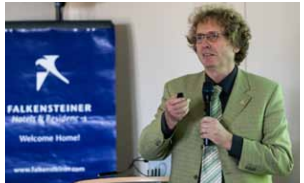
Prof. Braungart (Leuphana Universität Lüneburg, EPEA Internationale Umweltforschung Hamburg), Erfinder des Cradle-to-Cradle Prinzips, regt zum Nach- und Neudenken an: Er fordert einen grundlegenden Paradigmenwechsel bereits bei der Herstellung von Produkten, sodass sie nach Gebrauch zu 100 Prozent der Natur zurückgeführt oder immer weiterverwendet werden können. Unternehmen werden so unabhängiger von Preisschwankungen an den Rohstoffmärkten, zudem wird die Wirtschaftlichkeit vom Rohstoff bis zum Verbleib des Produkts betrachtet, was den Wertschöpfungszyklus verbessert.

Das niederländische Unternehmen Desso produziert seine Teppiche mit gesundheits- und umweltförderlichen Materialien, die im Gegensatz zu herkömmlicher Ware keine giftigen Moleküle ausstoßen, sie verbessern sogar die Raumluft, indem sie Schwebeteilchen binden. Alle Produkte sind so konzipiert, dass sie nach ihrem Gebrauch in geschlossene Kreisläufe eingebracht und hochwertig wiederverwendet werden können. Darüber hinaus bietet Desso eine Leasing-Option inklusive eines umfassenden Service von der Verlegung über die Reinigung und Pflege bis hin zur Entfernung an. Ein bedeutender Schritt beim Übergang zur Kreislaufwirtschaft: Anstelle den Teppich zu besitzen, sieht der Kunden ihn als eine Dienstleistung. Desso nimmt den Teppich am Ende seiner Nutzungsdauer zurück und recycelt ihn.