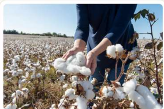
Fashion and apparel