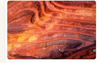
Mining and metals

Mehr Info: https://www.businessfornature.org/resources/sector-actions | 9