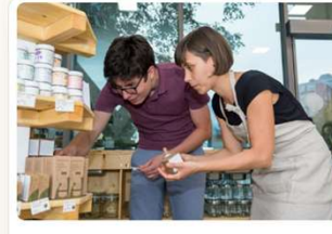
Household and personal care products