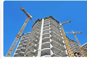
Construction materials – cement and concrete