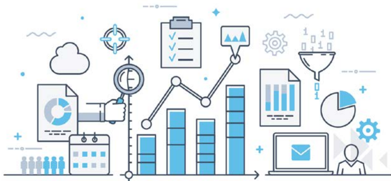
CHART OF THE WEEK