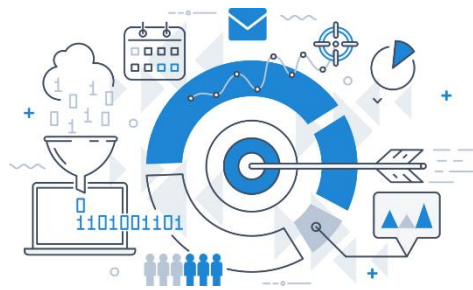
CHART OF THE WEEK