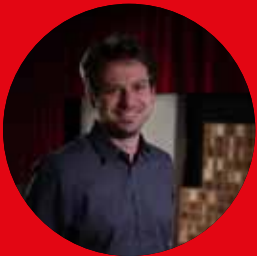
Horst Schnattler Klangkulisse e.U. www.klangkulisse.at