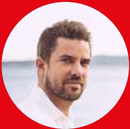
Heinrich Lentz Antimatter Product Design www.antimatter.eu