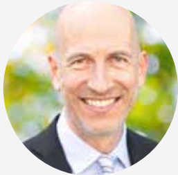
Univ.-Prof. Dr. Martin Kocher Bundesminister für Arbeit und Wirtschaft

Ich freue mich, dass wir mit unserer Kreativwirtschaftsstrategie für Österreich dazu beitragen können, Innovation und Transformation in der gesamten österreichischen Wirtschaft voranzutreiben!