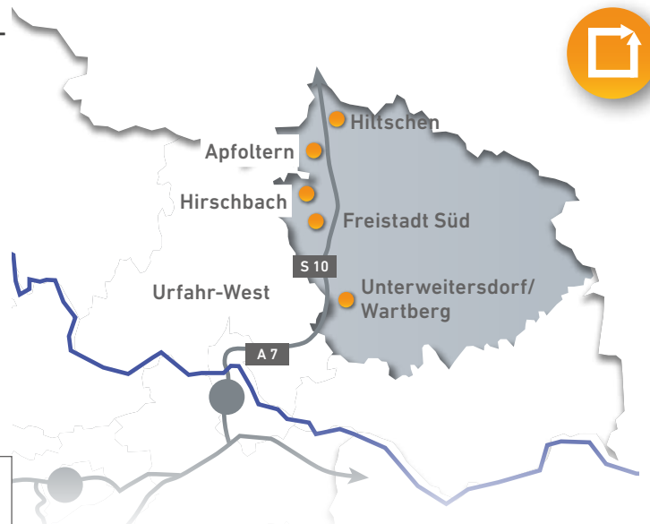
INKOBAs der Region Freistadt

Auf standortooe.at/fr kann jeder gewerbliche Flächen kostenlos anbieten und nachfragen (Büros, Geschäftsflächen, Produktions- oder Lagergebäude, unbebaute Betriebsgrundstücke).